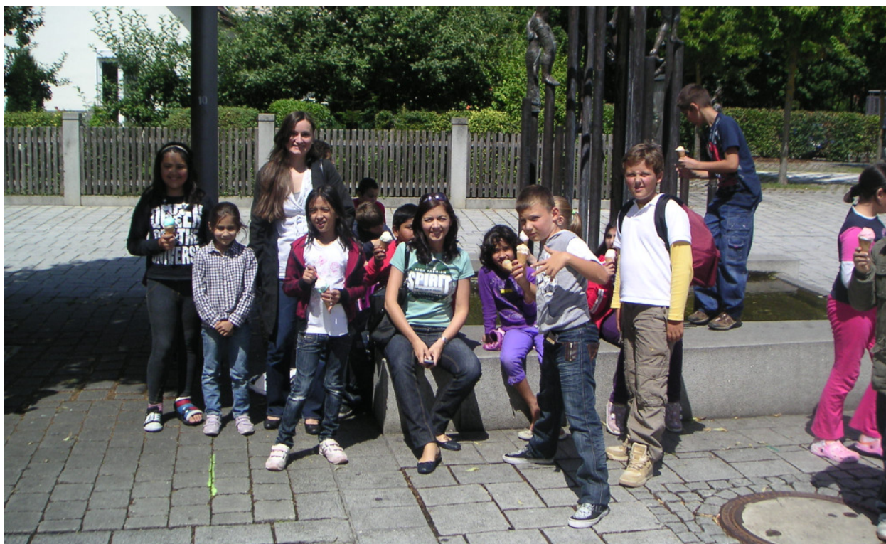
Hausaufgabenhilfe für Kinder mit Migrationshintergrund beendet das Schuljahr mit Eis essen. 40 Kinder wurden im letzten Jahr von einem fünfköpfigen Team betreut.